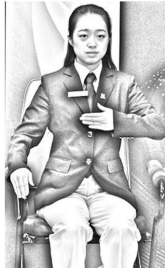
Figure 7 Hidden by what or whom