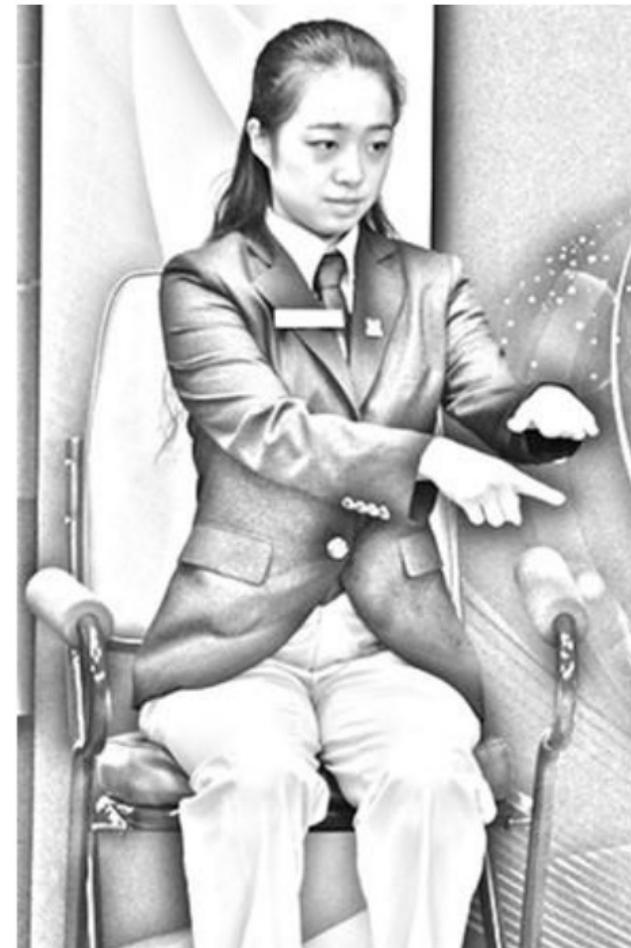
Figure 4 Below the playing surface