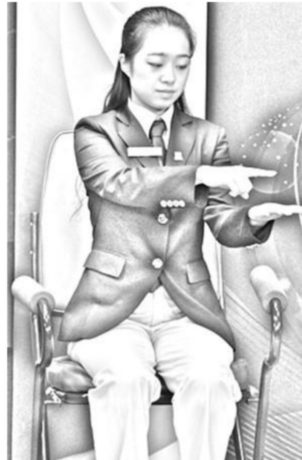
Figure 1 Not high enough