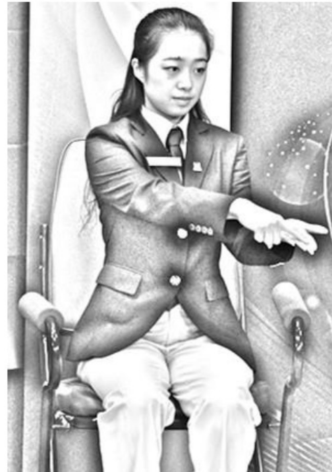
Figure 3 Ball resting on the fingers

Empfohlene Ansage: „BALL AUF DEN FINGERN“