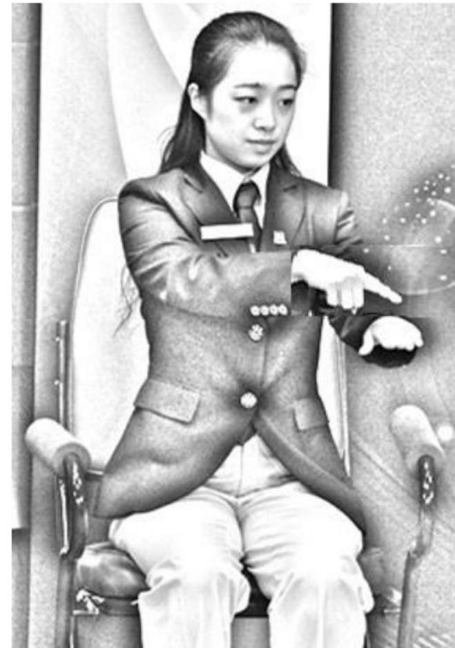
Figure 5 Inside the end line