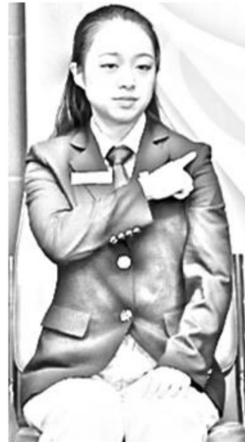
Figure 7(1) Verbal communication: Hidden by shoulder